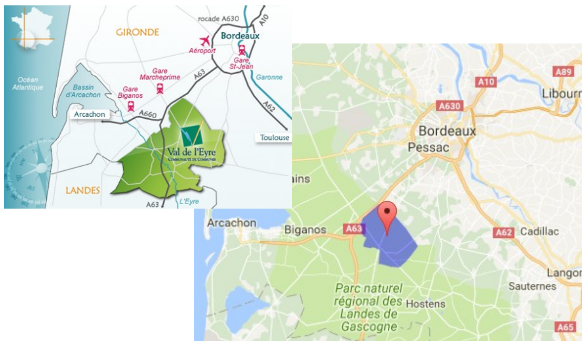
Localisation de la communauté de commune du Val de l'Eyre et de la commune du Barp

Le présent avis de la Mission Régionale d'Autorité environnementale (MRAe) porte sur la mise en compatibilité par déclaration de projet du plan local d'urbanisme (PLU) de la commune du Barp porté par la communauté de communes du Val de l'Eyre 1 , afin de permettre l'implantation d'un collège et d'un lycée d'enseignement général sur le secteur « Bric de Bruc ». La commune du Barp est située dans le département de la Gironde, entre la métropole bordelaise et le bassin d'Arcachon. Sa population est de 5 466 habitants (source INSEE 2016) pour une superficie de 107,3 km 2 .